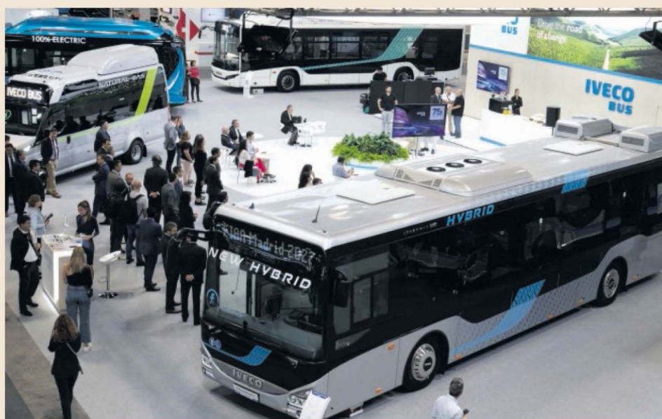
Exposición de autobuses ecológicos durante la anterior edición de la FIAA.

El descenso continuó en los años siguientes y así se llega a 2024 con 2.787 com-