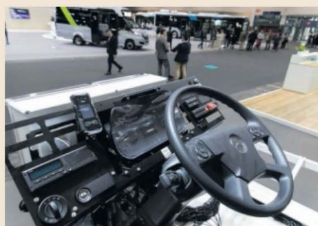
Volante y tablero de un autobús.

A causa de las fusiones, cada vez hay menos operadores y más grandes