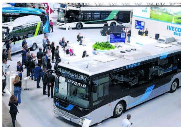
El salón ocupará los pabellones 8 y 10 del Recinto Ferial de Ifema Madrid

do por 2.787 empresas operadoras y una flota de 44.852 autobuses de servicio público, los cuales transportan anualmente a 3.144 millones de viajeros conectando a 8.000 poblaciones.