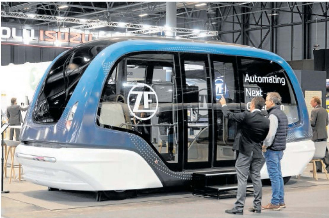
La feria presenta las innovaciones más destacadas en el sector // IFEMA MADRID