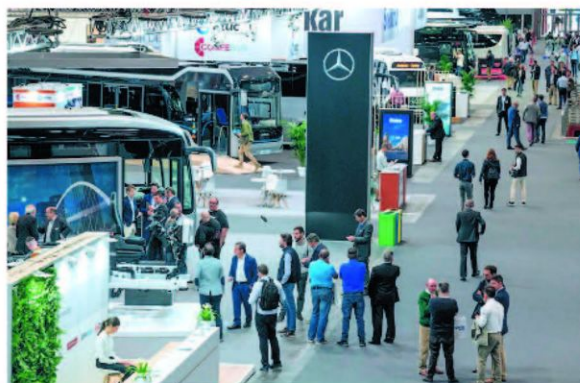
Todas las asociaciones del sector renuevan su apoyo a FIAA

El sector del autobús y del autocar es el eje vertebral de la movilidad en España, como demuestra el dato de que «uno de cada dos viajes realizados en transporte público en nuestro país se lleva a cabo en autobús». Según la patronal Confibus, es un sector forma-